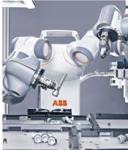
ABB YuMi® Adını Verdiği Geleceğin İnsan-Robot İşbirliği Modelini

Plastik üretim makinelerinin dahil oldukları enerji sınıfları, EUROMAP tarafından hazırlanan etiketlerle gösterilecek. Kullanımı gönüllü olacak olan uygulama ile şimdiye kadar her üreticinin kendi işaretleriyle belirttiği enerji sınıfları, ortak etiketlerle gösterilebilecek, alıcıların değerlendirme süreçlerini kolaylaştıracak.